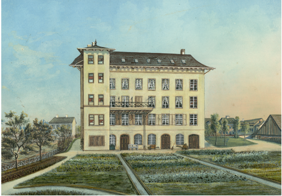
87 Bandfabrik Thurneisen am Aeschengraben, anonymes Aquarell, undatiert. — Gewerbetreibende, Angehörige des Bürgertums und ihre Dienstboten waren als «Alteingesessene» – wenn auch genrehaft typisiert – fester Bestandteil Basler Stadtansichten der Vormoderne. Die traditionelle Stadtarmut und das wachsende Proletariat bleiben, auch auf Bildern von Fabriken, unsichtbar. Erst die Fotografie ab den 1860er-Jahren lässt eine vielfältigere Bevölkerung erkennen.

«Appreteuren» behandelt, um die gewünschten Eigenschaften zu erlangen. Stuhlschreiner hielten die Webstühle in Schuss. 25