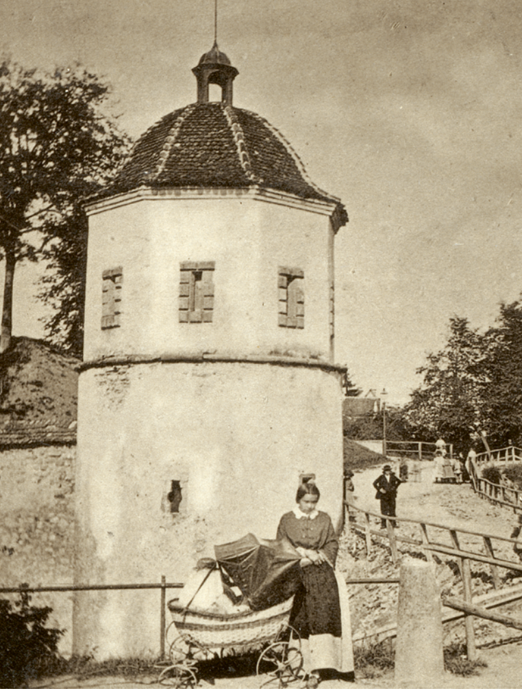
96 Rundturm ‹Luginsland› bei der Petersschanze, anonyme Fotografie, 1863. — Der Rundturm mit dem sprechenden Namen hatte die Funktion eines Aussichtspostens und befand sich vor der Hauptbefestigung bei der ‹Neuen Vorstadt› (Hebelstrasse), dem ‹Hohen Wall›. Der Turm wurde 1871 abgebrochen. Vermutlich ist es eine Kindermagd, die vor dem ‹Luginsland› steht und den Kinderwagen schiebt.

Die Berufsbezeichnung ‹Magd› war weniger mit konkreten Tätigkeiten als mit einem spezifischen Arbeitsverhältnis verbunden und geprägt von einem starken Machtgefälle. Ebenso wenig sagt diese Bezeichnung über den Lebensstandard einer Frau aus, die den Beruf ausübte. Beides, Tätigkeiten und Lebensumstände, hing in grossem Mass von der Dienstherrschaft ab. In reichen Haushalten wurden in der Regel mehrere Angestellte beschäftigt, die eigene Aufgabengebiete hatten. Oft gab es da unter den Angestellten eine hierarchische Ordnung. In der Hälfte der Haushalte, die weibliches Dienstpersonal beschäftigten, arbeitete aber nur eine Magd. 98