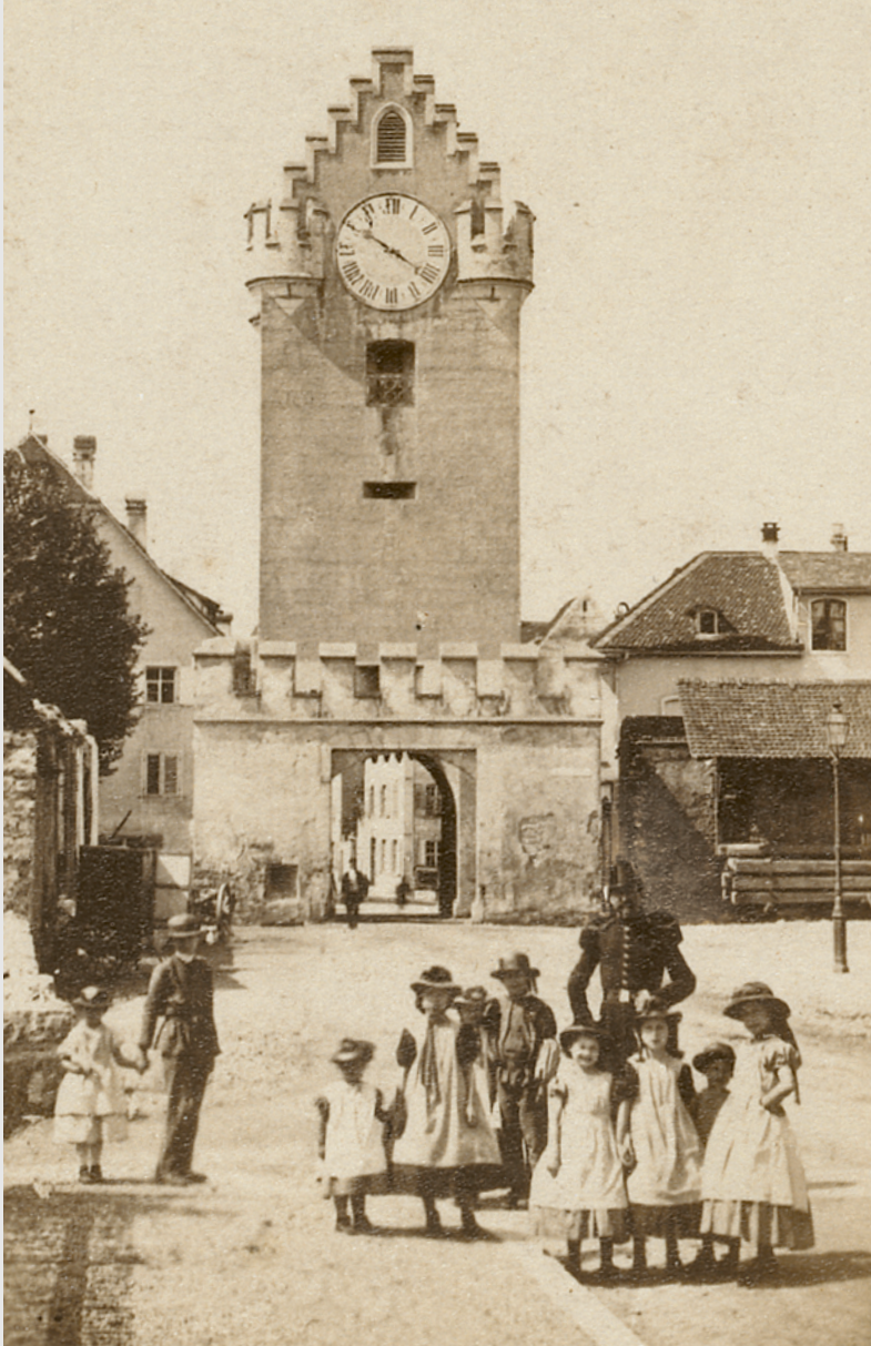
91 Riehentor mit Kindergruppe und Uniformiertem, anonyme Fotografie, vor 1864.

St. Gallen, sowie gegen den Korporal und zwei Soldaten am Tor aus. Im folgenden Jahr wurde die Fabrik weit weg nach Arlesheim verlegt, und nach dem Vorfall am Tor dürfte nicht nur die Aussicht auf einen Betrieb mit Wasserkraft ausschlaggebend dafür gewesen sein. 59 Silvio Raciti