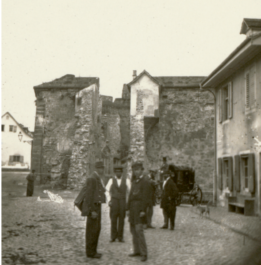
92 «Fröschenbollwerk», anonyme Fotografie, zwischen 1865 und 1869. — Das Fröschenbollwerk, ein Teil der Stadtbefestigung in der Nähe des Spalentors, wurde zwischen 1865 und 1869 mittels Abbruch und Sprengung beseitigt. Eine Personengruppe, vermutlich Bauarbeiter, versammelt sich während dessen Abtragung vor der Rückseite des Fröschenbollwerks.

merkmänner zettelten 1844 eine «Revolte» an. Die Streiks endeten mit der Ausweisung der Drahtzieher und schlugen sich nicht in den Gerichtsakten nieder. 63