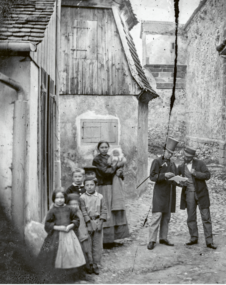
99 Rondenweg entlang der Stadtmauer am Spalentor. Foto: Jakob Höflinger (Detail), 1863. —

Die Aufnahme zeigt der Überlieferung nach Christine, die Magd einer Zunftfamilie, mit vier Kindern und einem Säugling sowie rechts einen Ladenbesitzer mit einem Makler («Sensal»), dessen Aufgabe es war, Finanz- und Handelsgeschäfte zu vermitteln. Das Foto wurde am Weg entlang der inneren Stadtmauerseite (Rondenweg) mit dem Spalentor im Rücken aufgenommen. Die Mauer hatte zu dieser Zeit keine Funktion mehr, ihr Abbruch erfolgte in dieser Gegend – mit Ausnahme des denkmalgeschützten Spalentors – bis Ende der 1860er-Jahre.